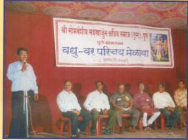
वधुवर परिचय मेळावा समारोप दि. ८ जानेवारी २००६