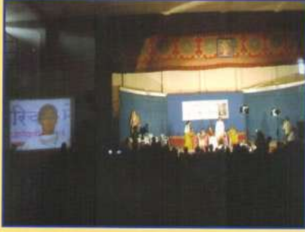
वधुवर मेळावा प्रसंगी क्लोज सर्किट टिव्हीवर वधुचे दूरदर्शन