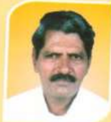
उपाध्यक्ष श्री. अशोक लक्ष्मणसा रंगापुरे