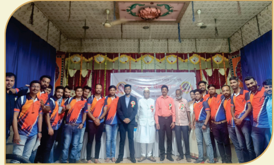
२०२२ साली ट्रस्ट, युवक संघटना, महिला मंडळ, वधूवर सूचक मंडळ संयुक्त आयोजित १५ ऑगस्ट २०२२ रोजी समाजातील गुणवंत विद्यार्थ्यांचा सत्कार समारंभ प्रसंगी