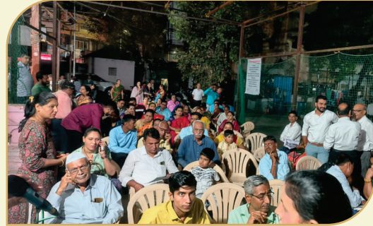
प्रतिमाह वधु-वर मेळाव्याचे आयोजन करतेवेळी वधू-वर सूचक मंडळ