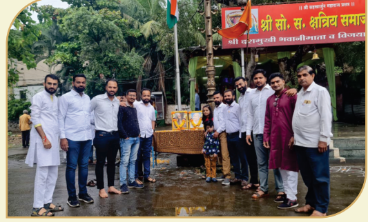
१५ ऑगस्ट २०२२ स्वातंत्र्यदिन स्वागट येथे धवजारोहन वेळी युवक संघटना व समाज बांधव