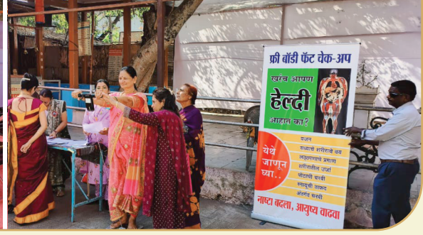
२०२३ साली ट्रस्ट, युवक संघटना, महिला मंडळ, वधूवर सूचक मंडळ व शिक्षण मंडळ संयुक्त आयोजित १९ फेब्रुवारी शिवजयंती निमित्त रक्तदान शिबीर वर्ष ३ रे व आरोग्य शिबीर प्रसंगी