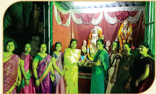
२०२२ साली गणेशोत्सव मध्ये महिला मंडळ मान्यवरांचा सत्कार करताना