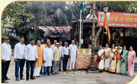
२६ जानेवारी २०२३