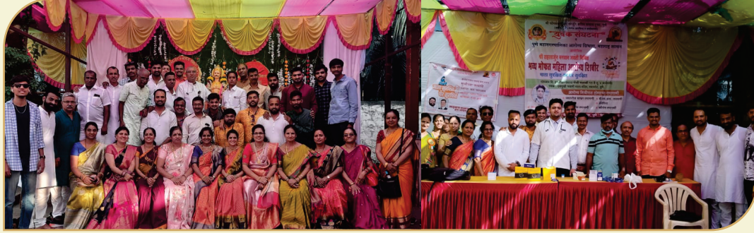
सहस्रार्जुन महाराज जयंती २०२२ प्रसंगी ट्रस्ट, सर्व उपसंस्था व उपस्थित समाज बांधव