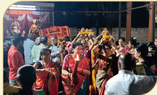
२०२३ साली हनुमान जन्मोत्सवदिनी श्री दशमुखी भवानी माता पालखी सोहळा