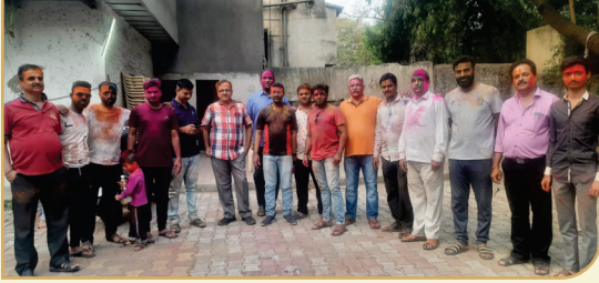
२०२३ साली महिला मंडळ व युवक संघटना आयोजित रंगपंचमी प्रसंगी ट्रस्टी, युवक संघटना, महिला मंडळ व समाज बांधवांसह रंगपंचमीचा आनंद घेतला.