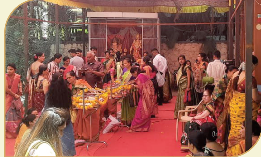
२०२३ साली महिला मंडळ आयोजित रामजन्म निमित्त बारसे सोहळा