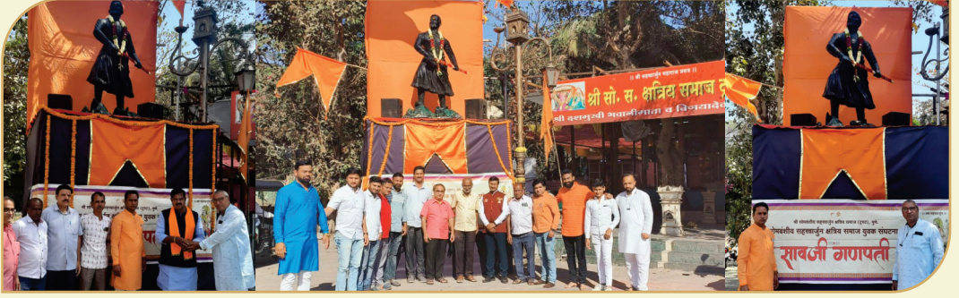
२०२३ साली पुणे समाजात प्रथमच युवक संघटना आयोजित शिवजयंती साजरी वेळी मान्यवरांचे स्वागत तसेच ट्रस्टी व युवक संघटना, वधु-वर सूचक मंडळाचे सभासद