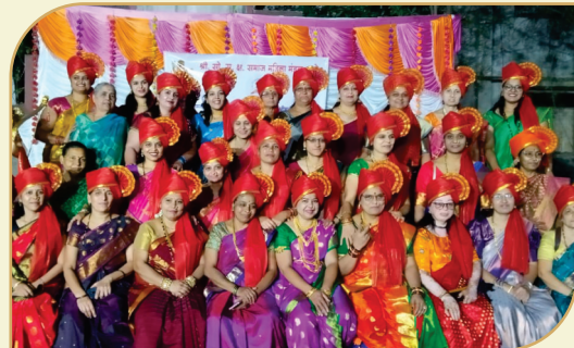
८ मार्च २०२३ महिला दिनाचा उत्साह