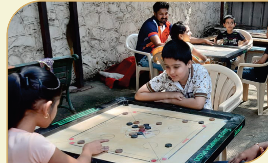
ट्रस्ट व उपसंस्था मार्फत दिवाळी स्पर्धेचे आयोजन