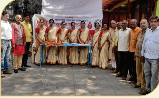
२०२२ साली ट्रस्ट, युवक संघटना, महिला मंडळ, वधूवर सूचक मंडळ संयुक्त आयोजित रक्तदान शिबीर वर्ष २ रे व आरोग्य शिबीर