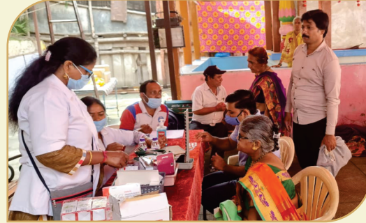
नवरात्र उत्सव २०२२ साली मान्यवरांचे स्वागत तसेच ट्रस्ट व उपसंस्था मार्फत मोफत डोळे तपासणी शिबीर, आरोग्य शिबीर, स्पर्धा यांचे नियोजन